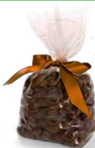
G 160 (0,04 mm)