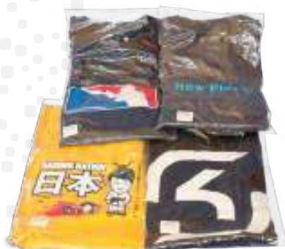
G 160 (0,04 mm) TIRA PROTECTORA DE SOLAPA ADHESIVA ANTIESTÁTICA